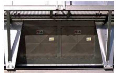
Events StuVent sur filtre

L'événement d'explosion STUVENT fonctionne de façon extrêmement simple : dès que la pression d'ouverture requise ( P_{stat} ) est atteinte, le disque s'ouvre sur les trois côtés prédécoupés. Le quatrième côté n'est pas prédécoupé et il fait office de charnière pour éviter les projections. dezelfde specificaties.