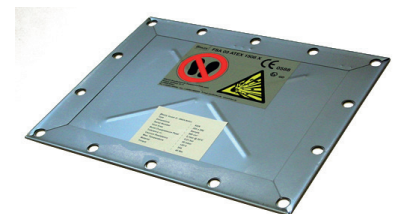
Event plat type KER