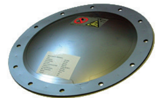
Event type GE cylindrique