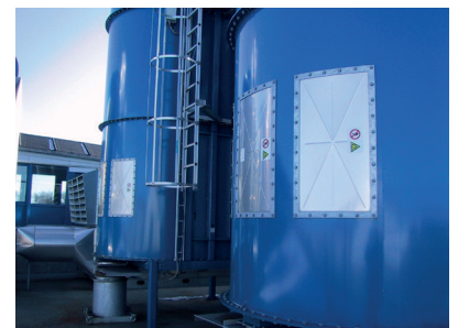
Events courbés type KER-W