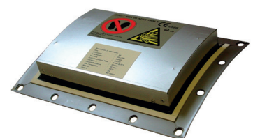
Event courbé type KE-W avec isolant extérieur